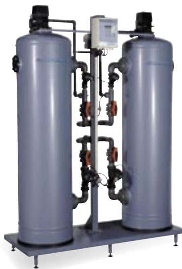
Stacja zmiękczenia wody typ SMH 602.